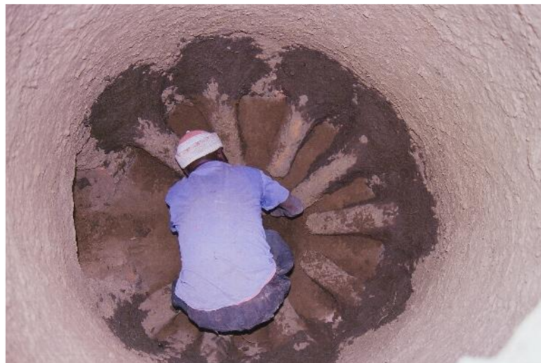
Photo n°2 : Ajustement des tuyères depuis l'intérieur du fourneau (Photo, Marie France, 06/02/2004)