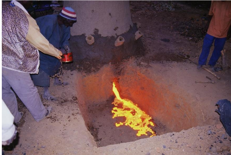
Photo n°3 : Evacuation de scories en de cours réduction (Photo, Marie France, 07/02/2004)