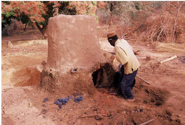
Photo n°4 : Extraction de l'éponge de fer du fourneau (Photo, Marie France, 08/02/2004)