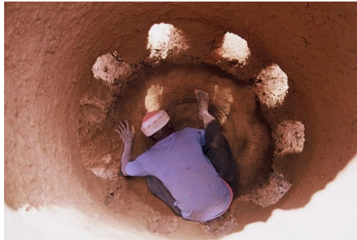
Photo n° 1 : Aménagement du creuset du fourneau (Photo, Marie France, 06/02/2004)

La réduction de minerai de fer expérimentale réalisée dans le village de Niouma-Makana par des métallurgistes bamanan du village de Nonkon a consommé 672 kg de charbon et 300,30 kg de minerai de fer. A l'issue de la réduction, il a été recueilli 62,20 kg de fer et 160,25 kg de scories répartis en 51,60 kg pour la fosse adjacente, 46,65 kg dégagés autour de l'éponge encore à l'intérieur du fourneau et 62 kg après épuration. Les résultats d'une réduction sont sans fonction de plusieurs paramètres notamment la qualité du minerai et du combustible, le processus de la réduction, etc. Par exemple Eric Huysecom (1996, film vidéo, 52 mn) donne, pour une réduction en pays dogon (Mali), les résultats suivants : 300 kg de charbon de Prosopis africana , 242 kg de minerai pour une production d'une éponge de "fer doux" de 69 kg. Louis Archinard (1885) rapporte 150 kg de masse métallique pour une opération de réduction dans un fourneau de deux (02) à trois (03) mètres de hauteur. Il ne précise toutefois pas la localité. Les photos 1 à 4 sont relatives à la réduction expérimentale